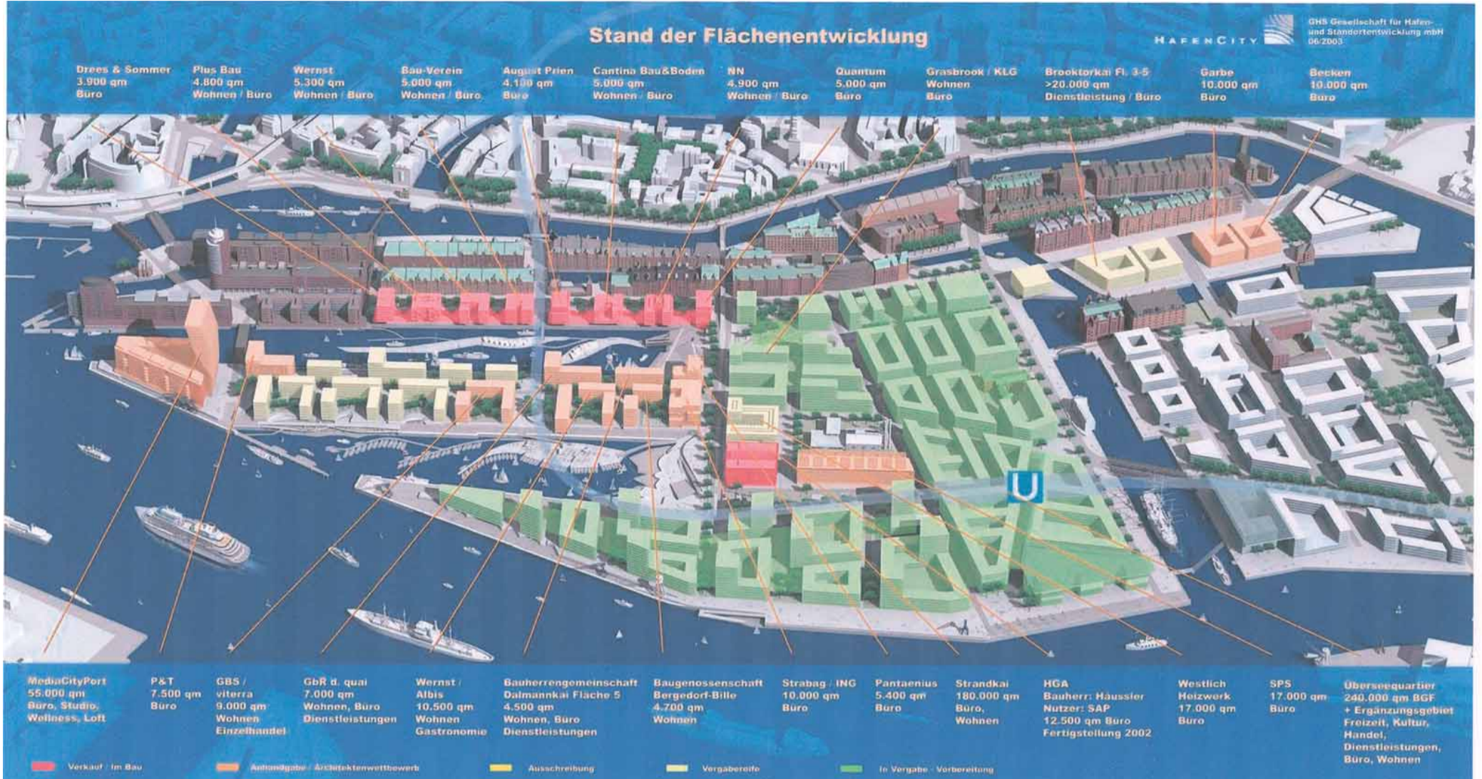
Die Hafencity, Paradeobjekt für attraktives zukunftsweisendes Wohnen und Arbeiten am Hamburger Hafenrand, soll von wilhelm.tel versorgt werden

Der Itzehoe Standort der D+S europe AG, mit 2000 Mitarbeitern in sieben Bundesländern einer der größten deutschen Outsourcing-Dienstleister im Bereich Kundenprozessmanagement und Telemarketing, wird ab Oktober an das Netz von wilhelm.tel angebunden.