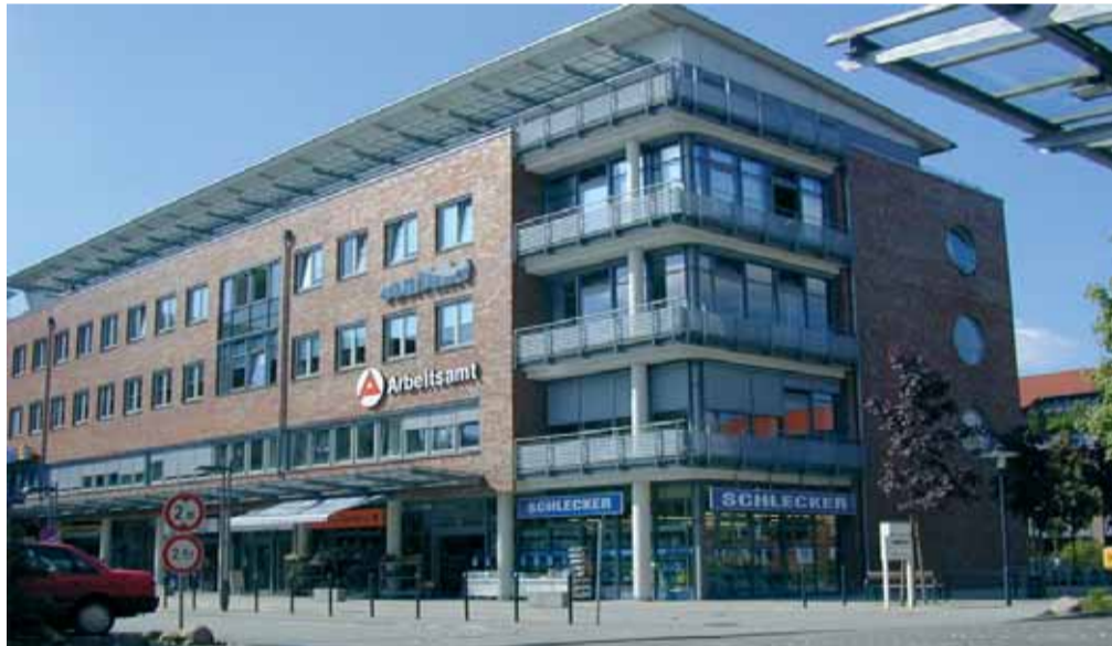
Die 480 Itzehoe Mitarbeiter der D+S europe AG telefonieren künftig mit wilhelm.tel.

Volker Hallwachs: „Wichtig für den Kunden war der Sicherheitsaspekt. Der Betrieb einer derart bedeutenden Niederlassung mit großem Communication Center-Bereich darf nicht unterbrochen werden. Deshalb hat wilhelm.tel für Itzehoe ein Glasfaser-Pärchen gelegt, das durch redundante Versorgung (durch eine Ringversorgung) den ständigen Betrieb gewährleistet. Sollte der Ring nun an einer Stelle, beispielsweise durch Baggerarbeiten, unterbrochen werden, wird automatisch anders herum gesteuert.“